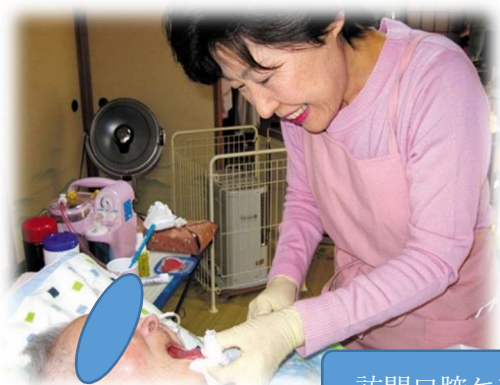
訪問口腔ケアの様子！