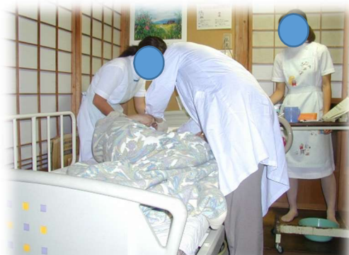
訪問歯科診療の様子